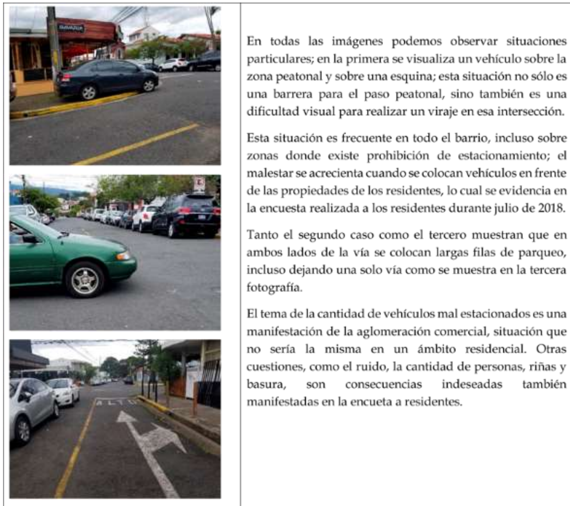
Figura 3. Barrio Escalante: algunos de los problemas, septiembre, 2017

El siguiente cuadro muestra dinámicas y problemas dentro del barrio como consecuencia de actividades comerciales puntuales.