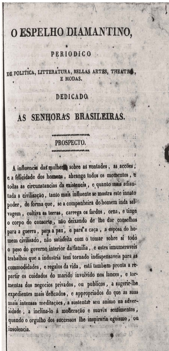
Figura 1 – O Espelho Diamantino , n. 1, 1827, p. 1.