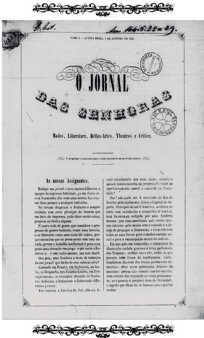
Figura 2 – Primeira página com cabeçalho de O Jornal das Senhoras , n. 1, 1852, p. 1.

Em sua primeira edição do ano de 1852 (Figura 2), a coluna de moda – escrita em formato de carta e assinada por Christina – contém uma descrição detalhada de um figurino de baile anexado ao periódico o qual, infelizmente, não está disponível para consulta on-line . Sabe-se que uma ilustração de moda – ou estampa, como era