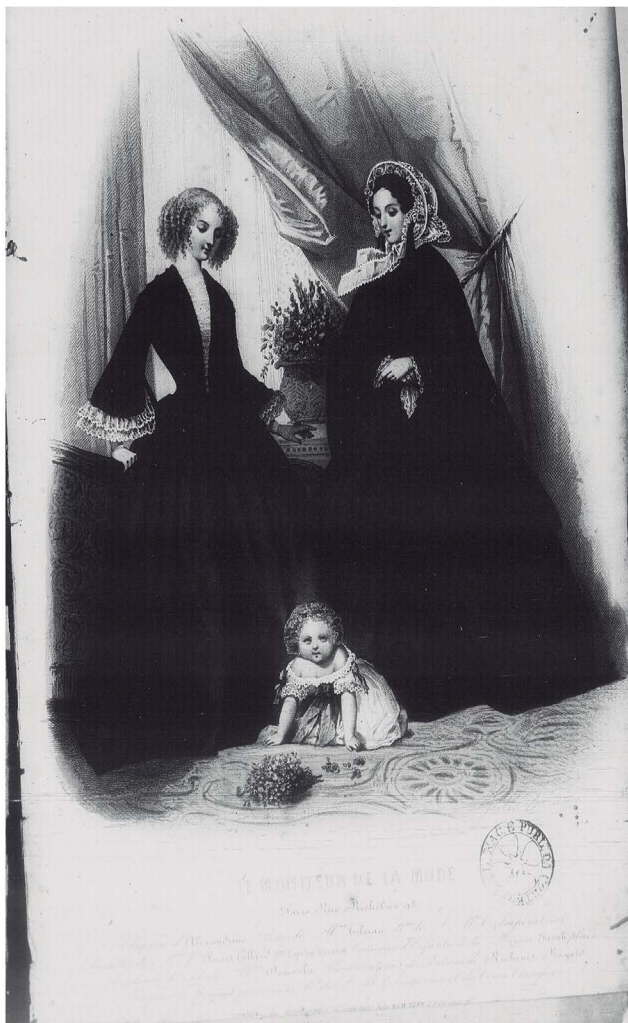
Figura 3 – Vestuário de casa e de passeio. O Jornal das Senhoras , n. 1, 1855, p. 7.

Por fim, em seu último número a coluna Modas traz as tendências do inverno parisiense. Os chapéus continuam em uso, mas com copas pequenas, arredondadas e chatas, já que terão alguns adornos sobre a aba – como plumas, laços, rendas e veludos pretos. Também é discutido o uso das vasquinhas (saias que eram usadas sobre a roupa, pregueadas na cintura), algumas mulheres já não querem usá-las, mas outras – inclusive as modistas – defendem seu uso, uma vez que ajudam a alongar