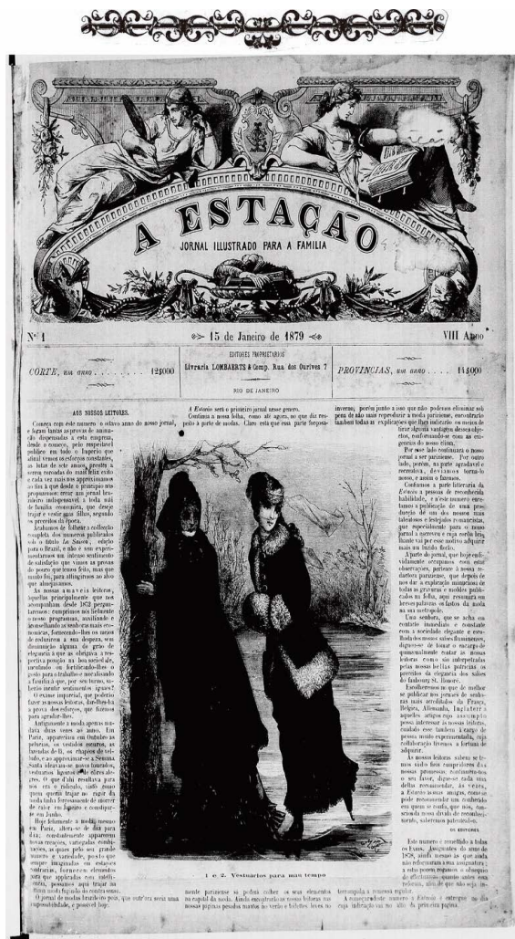
Figura 4 – Capa de A Estação , n. 1, 1879, p. 1.

Na mesma edição, ainda confirmando a influência estrangeira na moda brasileira, os editores a mencionam direta e indiretamente, de modo negativo, ressaltando como as diferenças climáticas entre os países são um empecilho para seguir o estilo francês aqui no Brasil: “[em abril a moda francesa era para o verão, enquanto aqui se aproximava o inverno] [...] O que d’ahi resultava para nós era o ridículo, visto como quem queria trajar no rigor da moda tinha que forçosamente tinha de morrer de calor em Janeiro e constipar-se em Junho” ( A ESTAÇÃO , n. 1, 1879, p. 1).