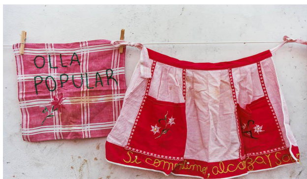
Foto 2 - “Las ollas y el arte de los cuidados”, Centro Cultural Los amigos de barrio Sarmiento – Autora: Analía Cid

En ese contexto, son las redes de mujeres, y en nuestro caso de migrantes, las que sostienen la vida en los barrios más vulnerables, mitigando los efectos de la crisis sanitaria producida por la pandemia. Son las redes, producto de un trabajo territorial que ya venían realizando para cubrir las necesidades de la población, las que cubren los espacios a los que no llega un estado que no consigue modificar las desigualdades estructurales que los afectan. En este recorrido, hemos mostrado la capacidad de agencia de las mujeres migrantes para desplegar múltiples estrategias de cuidados comunitarios basado en la organización colectiva y en la creación de redes con el Estado, otras organizaciones y la propia universidad, elevando sus