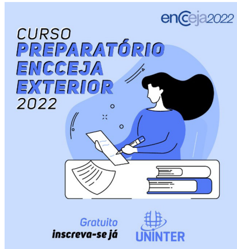
Figura 7 – Exemplos de postagens no Facebook de organizações que promovem cursos preparatórios para o Encceja: Uninter Japão