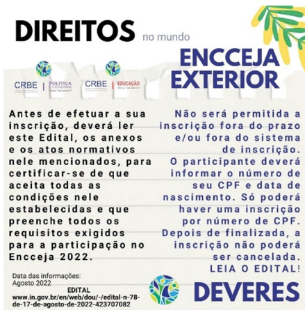
Figura 2 – Exemplos de postagens no Facebook de organizações da sociedade civil voltadas para brasileiros no exterior sobre o Enceja: Conselho de Cidadãos do Consulado-Geral do Brasil em Faro