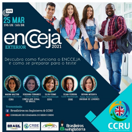
Figura 3 – Exemplos de postagens no Facebook de organizações da sociedade civil voltadas para brasileiros no exterior sobre o Enceja: CCRU – Conselho de Cidadania do Reino Unido