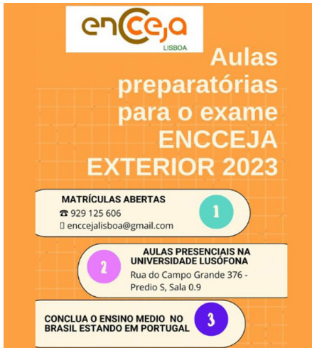
Figura 6 – Exemplos de postagens no Facebook de organizações que promovem cursos preparatórios para o Encceja: Enceja Lisboa