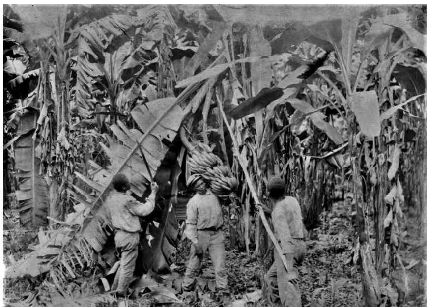
Figura 1. Trabajadores afrocaribeños en finca bananera del Caribe costarricense