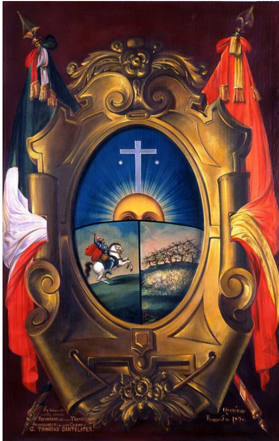
Figura 2. Escudo de la ciudad de Querétaro.

Cincuenta años antes, «el cabildo extraoficial» 30 había obtenido el título de ciudad (1655) beneficiando económicamente a la Real Hacienda; de igual manera, había forjado diversos elementos identitarios que se reflejaban en el escudo de armas, como los cultos a Santiago Apóstol y a la Cruz de Piedra, y que también se expresaban en la recién cancelada fiesta de la Invención de la Santa Cruz (1694), donde se recordaba la ocupación del territorio por el gobierno español y se exaltaba a la Cruz de Piedra, imagen que daba cuenta de la conquista espiritual y la integración del espacio a la monarquía. En dicho evento, se congregaba a los diversos grupos sociales, se hacían representaciones de moros y cristianos, corridas de toros y quema de fuegos 31 .