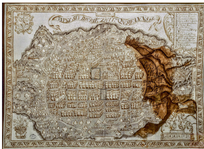
Figura 3. Tablados de las plazas de San Francisco (cuadro superior) y Santa Clara (cuadro inferior) durante la aclamación.