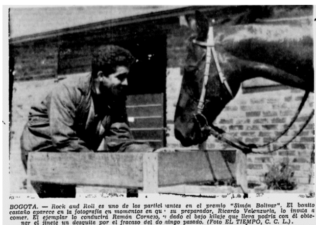
Figura 7. Rock And Roll, caballo famoso en Bogotá, año 1958. 60