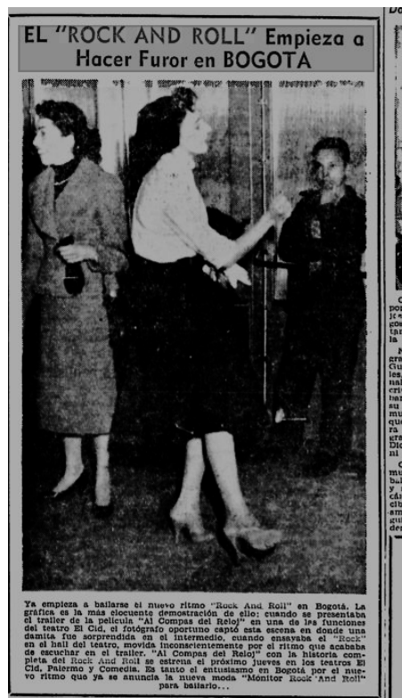
Figura 3. El Rock and Roll en Bogotá. Intermedio, 26 de enero de 1957. 47

Existen pruebas documentales para indicar que la censura tuvo lugar de manera recia durante al menos 40 días como también nos indica Pérez y, sin embargo, eso no impidió que la moda se tomara diferentes escenarios culturales en las ciudades y entre los sectores más acomodados, donde estética, música y baile tuvieron más aceptación. Junto con la película se lanzó una colección de ropa femenina que se denominó «monitor Rock and Roll», de la diseñadora Mireya Fashions, que tomó como referencia, además del nombre del género musical, el del programa Monitor de la emisora Nuevo Mundo. Se explica que el programa Monitor: