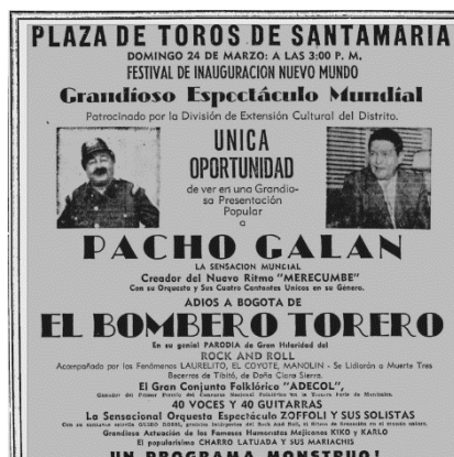
Figura 5. Publicidad donde se exhibe que se iba a realizar una parodia de «Gran Hilaridad del Rock and Roll». 54

Una vez que pasó el furor de la película, los debates disminuyeron. No se hallaron referencias concretas sobre declaraciones del gobierno o de autoridades, más allá de las que se mencionaron en torno a la Iglesia católica por parte de la prensa. Esos debates llevaron a que se hablara de un posicionamiento de esta música en escenarios como el Carnaval de Barranquilla donde se habló de una «pugna musical» entre el «Merecumbé» y el «Rock and Roll» por causa del «terror que está causando en todo el país». 53 Un mes después de la presentación de la película se realizó un concierto por parte de la orquesta de Pacho Galán donde se puede leer que se iba a hacer una mofa al Rock and Roll.