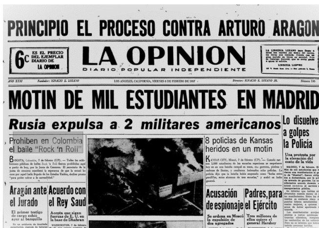
Figura 2. Portada del diario La Opinión , de Los Ángeles California, donde se menciona la prohibición del Rock and Roll en Colombia. 1957. 29

Este es un año particular porque se presentaron varios fenómenos de carácter político que coincidieron con la emergencia del Rock and Roll en los Estados Unidos y la difusión de las películas de James Dean y de Bill Haley. Por un lado, estaba claramente el agotamiento político y social que se venía presentando por cuenta de las decisiones tomadas por parte del presidente Gustavo Rojas Pinilla, militar que había ascendido en el año de 1953 como parte de una estrategia para resolver las disputas generadas al interior de los partidos y que, con el asesinato de Jorge Eliécer Gaitán en 1948, habían provocado la expansión de guerrillas en buena parte del país. Los enfrentamientos entre grupos apoyados por los partidos políticos dejaron tras de sí una huella indeleble en la memoria nacional dando lugar al periodo conocido como «La Violencia». Rojas Pinilla se había comprometido con el proceso de pacificación del país para lo cual firmó un armisticio que permitió que muchos guerrilleros se incorporarán a la vida y a la sociedad civil. Otros tantos prefirieron mantenerse al margen y tomaron distancia pese a las promesas del gobierno en muchos casos terminaron siendo incumplidas.