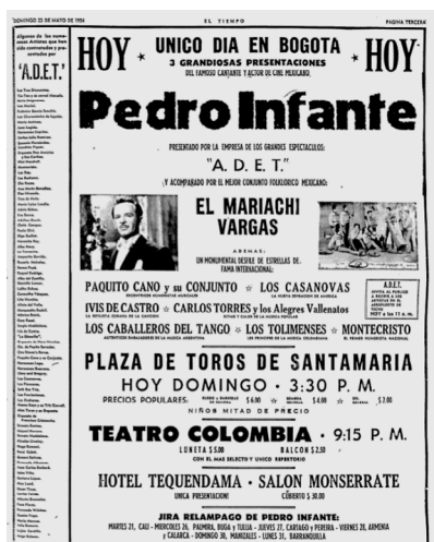
Figura 1. Publicidad de la primera visita de «Pedro Infante» a Colombia en el año de 1954. También se destacan otros grupos y artistas de varios géneros populares por aquel entonces, incluyendo el Tango. 18

mes de abril de 1957, con la muerte de Pedro Infante, el gobierno declaró tres días de luto nacional. 17