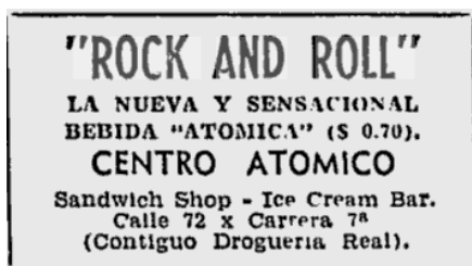
Figura 6. Bebida que lleva el nombre Rock and Roll en el año 1957. Bogotá, Intermedio . 59

fueron bautizados de esa manera, así como equipos de fútbol infantil 57 y bebidas que fueron presentadas como novedosas. 58