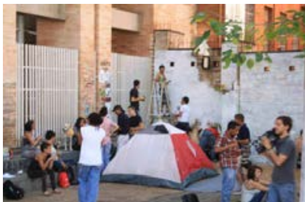
Figura 1. Fotografía de Campamento de Denuncia y Resignificación del Territorio.