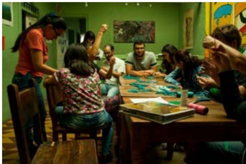
Figura 2. Escena del Taller Artístico en la Casa Cultural Utopía.

Otros sujetos y grupos participantes de la RAAP, con ocupaciones distintas a las nombradas, suelen realizar tareas relacionadas con el apoyo logístico-operativo, cooperando en la organización de los eventos, tomando fotografías y vídeos, preparando alimentos, entre otros. Sus motivaciones para hacer parte del grupo se relacionan, según sus discursos, con aspectos como el disfrutar con los amigos, ser reconocidos, colaborar en un colectivo y realizar funciones de trabajo comunitario.