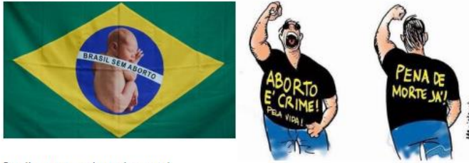
Brasil contra a cultura de morte!