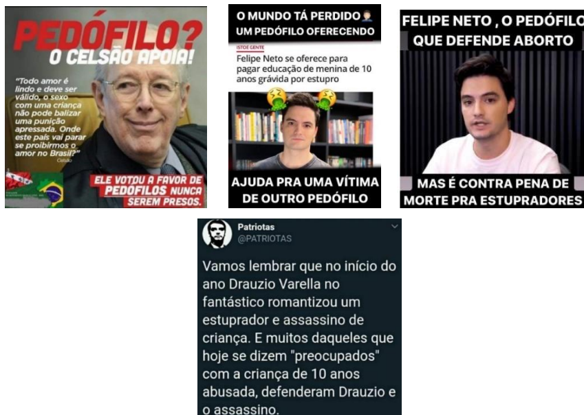
Imagem 4 – Imagens que associam adversários à pedofilia

O youtuber Felipe Neto, em especial, com maior número de posts contrários, foi chamado de pedófilo, hipócrita e “péssima influência para as crianças”. Neto tem figurado como inimigo do bolsonarismo desde que passou a criticar Jair Bolsonaro em suas redes sociais e na imprensa, inclusive em entrevista ao The New York Times, em 22/07/20.