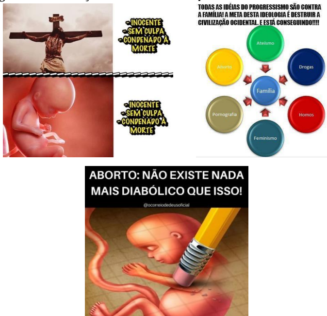
Imagem 2 - Construções sobre o aborto a partir do cristianismo e “família”