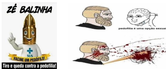
Imagem 3 – Imagens que sugerem violência no enfrentamento da pedofilia

O caso analisado resgata um discurso caro à extrema direita: a pedofilia. A temática foi explorada nos textos e nas imagens, tida como um mal, um crime imperdoável, um ato repulsivo. Sendo assim, a violência (agressão ou tiro) foi admitida como vingança/punição aos pedófilos. A ideia de justiça com as próprias mãos apareceu como possibilidade anunciada. Usando conjugação em primeira pessoa, muitos relataram o que fariam com o pedófilo ou estuprador caso a filha ou família fosse a vítima: “cortaria”, “arrancaria”, “mutilaria”, “deixaria vivo para sofrer”.