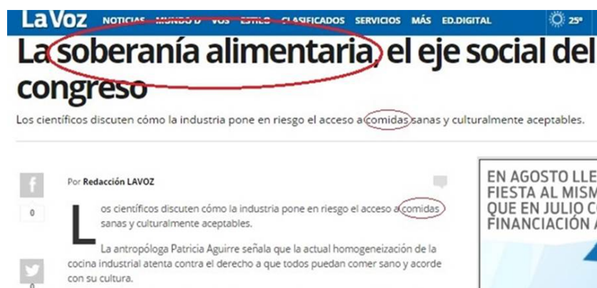
Imagen 1 Foto de la noticia: “La Soberanía Alimentaria, el eje social del congreso”, 15/11/2012