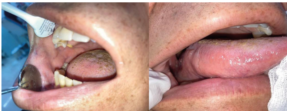
Figura 3. Remisión de las lesiones ulceradas en mucosa yugal y del borde lateral derecho de la lengua.

a las lesiones ulceradas en los diferentes puntos de la cavidad, algunas remitieron y otras se encuentran en proceso de cicatrización (figura 3).