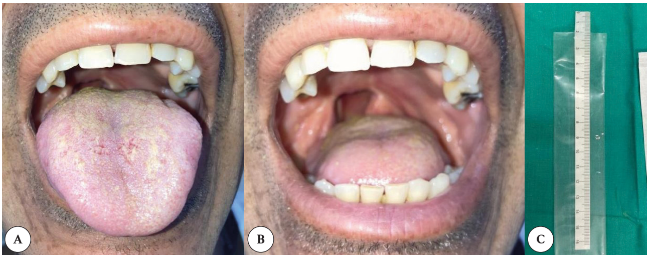
Figura 4. Control evolutivo posterior a las 5 sesiones de laserterapia: A) mejoría de la lengua saburral; B) remisión de las lesiones ulceradas y mejoras clínicas de la coloración de la cavidad oral al aumentar la salivación; C) resultado de la sialometría 3,5 cm.

En la última sesión se realizó una sialometría para evaluar la producción de saliva, obteniendo un resultado de 3,5 cm en 5 minutos, lo que evidenció una mejora significativa. Esta recuperación permitió devolver al paciente el confort mediante el aumento de la producción salival, la percepción adecuada de los sabores y la resolución de las lesiones ulceradas (figura 4).