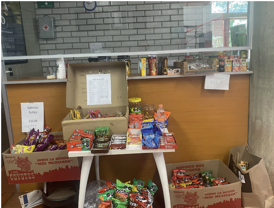
Figura 2. La tiendita