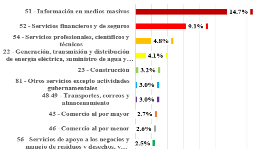
Gráfico 2. Sectores con mayor crecimiento promedio en el Estado de Durango (2003-2014)

Fuente: Elaboración propia con datos del Banco de Información Económica de INEGI