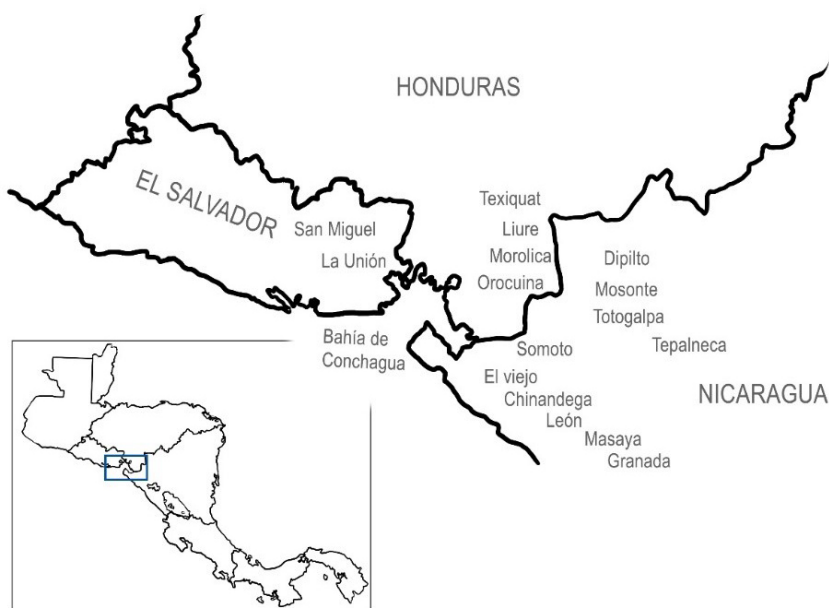
Mapa 3 - Zona controlada por la facción de José María Valle, 1845-1846.

La base social del movimiento estuvo conformada por nicaragüenses reclutados en Chinandega, El Viejo, Subtiava, Masaya, Granada, Somoto Grande, Tepalneca, Dipilto, Mosonte, Come-tierra y Totogalpa. En Honduras se reclutaron grupos de los pueblos de Texiguat, Orocuina, Liure, Morolica y Alaneas, con una considerable participación indígena. Algunos individuos involucrados fueron reclutados desde El Salvador, donde se habían refugiado como disidentes y se añadieron a la causa de Cabañas y Valle (véase el Mapa 3). 16