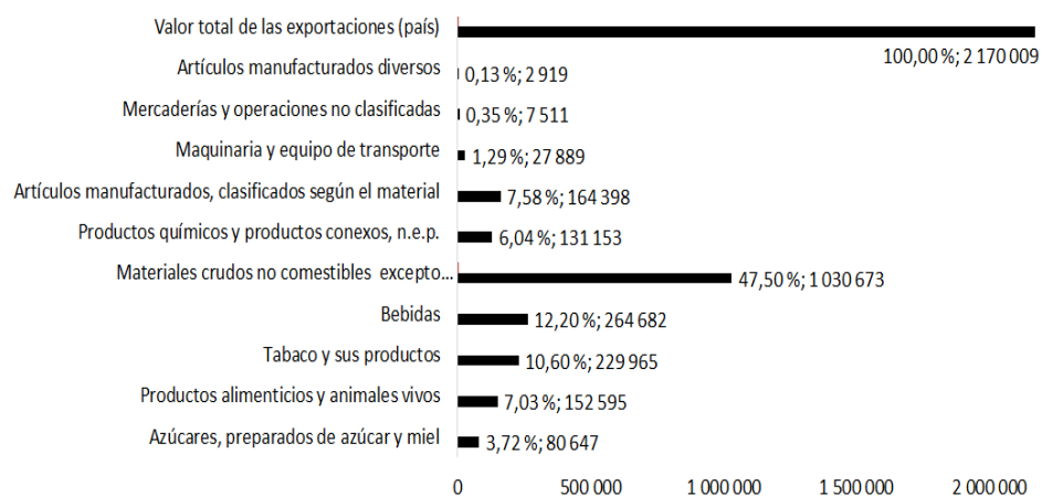
Figura 4. Exportaciones de productos seleccionados, 2021 (en % y MP).

Un análisis importante, es el estudio de la producción de bienes para la exportación y analizar su complejidad, lo que se muestra en la Figura 4.