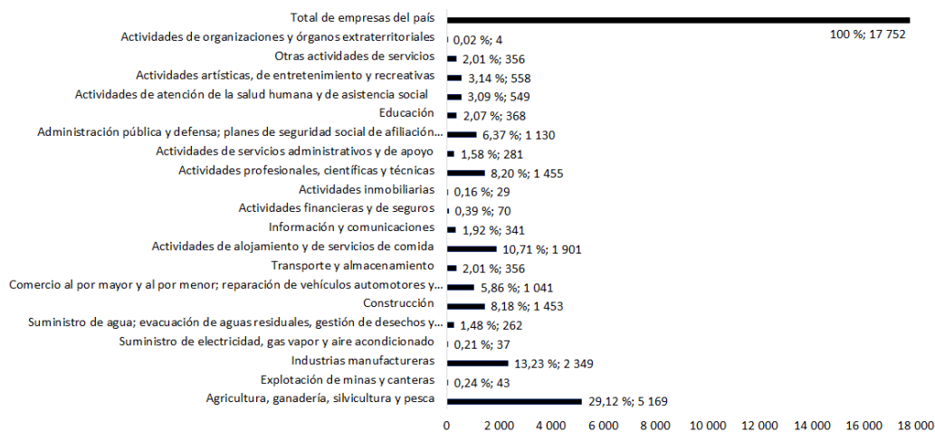
Figura 2. Cantidad de empresas por actividades económicas.

La figura anterior muestra que el mayor aporte al PIB recae en las actividades: salud pública y asistencia social, comercio, reparación de efectos personales, fundamentalmente por el incremento en valores de estos servicios de carácter social, así como transportes y otras, todas del sector no manufacturero de destino final, caracterizado por tener mayores encadenamientos en ambos sentidos, que generan mayores efectos arrastre y multiplicador. Las actividades construcción e industrias manufactureras (excepto industria azucarera), clasificadas en el sector manufacturero, con mayores encadenamientos hacia atrás y hacia adelante, tienen un menor peso el PIB nacional. Se complementa el análisis con la composición de empresas por actividades, lo que se muestra en la Figura 2.