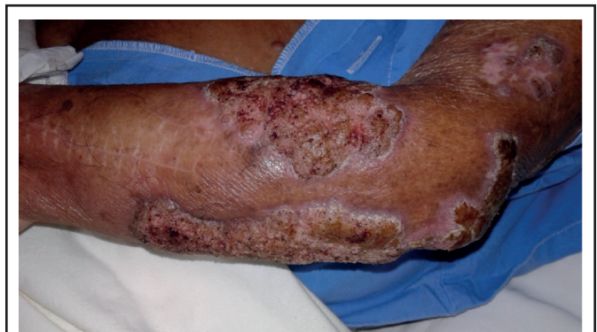
Figura 2. Cromoblastomicosis de 35 años de evolución en paciente de 91 años.