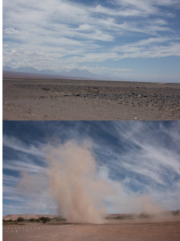
Figuras 1 y 2. Campos Minados. Desierto de Atacama, Chile Figures 1 and 2. Minefields. Atacama Desert, Chile