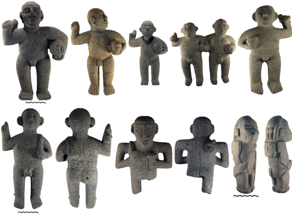
Figura 2. Esculturas antropomorfas de guerreros que se encuentran en la colección del Museo Nacional de Costa Rica.

El conjunto de esculturas antropomorfas analizadas en el presente trabajo fueron recuperadas en su mayoría de la Región Arqueológica Central 2 . El primer grupo contiene como motivo principal la representación de un personaje masculino de pie, el cual en este caso se denomina “guerrero”. Estos individuos eran todos hombres, con buena contextura física. Esta última condición era signo del tipo de labor que ejercían dentro del grupo. En la Figura 2, se observa la muestra utilizada.