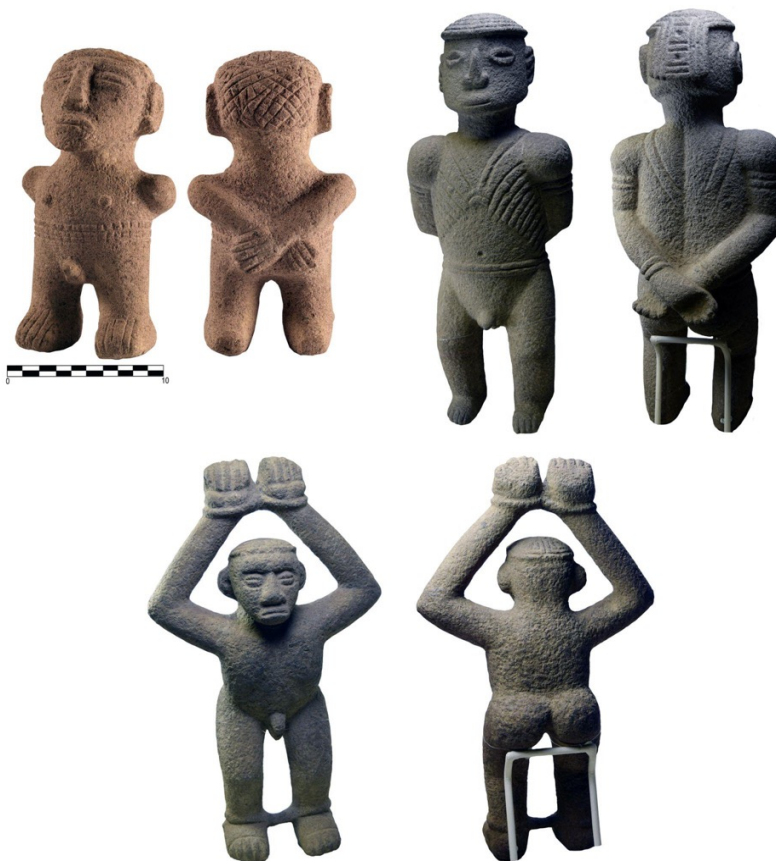
Figura 3. Representación de prisioneros tomados en contextos de guerra (Fotografías: arriba a la izquierda pieza 6404-colección Museo del Jade y de la Cultura Precolombina (INS), tomada por Pérez, 2022. Arriba a la derecha y abajo, objetos BCCR-P-0008 D2-colección Museo del Oro Precolombino, tomadas por Arce, 2018).

Tal y como se menciona en las distintas fuentes, una de las causas para la guerra fue la toma de prisioneros para distintos fines: como esclavos, para sacrificios o venta. Esta práctica también está representada, dentro de la evidencia arqueológica, en la estatuaria en piedra (Figura 3).