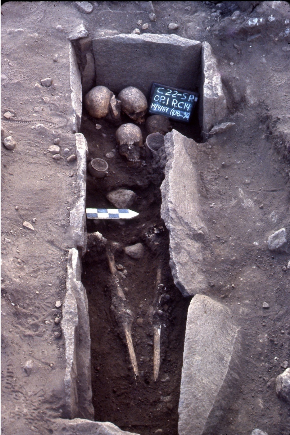
Figura 7. Individuo articulado junto a otros tres cráneos. Rasgo Cultural 14, monumento San Rafael.