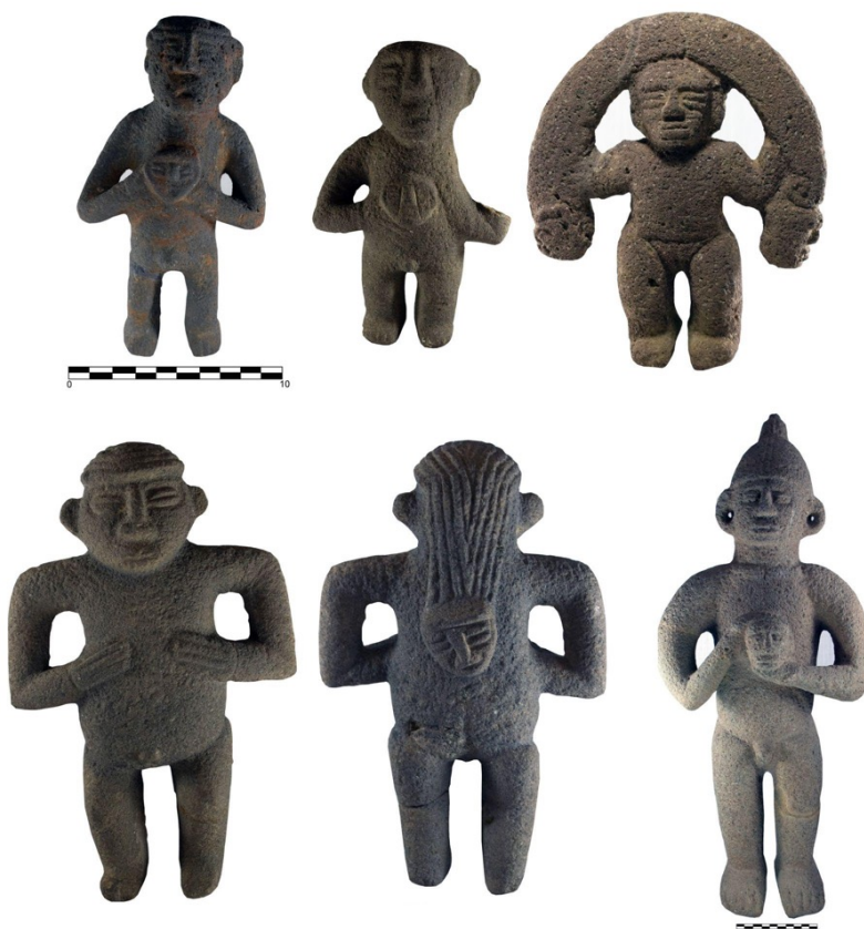
Figura 4. Representaciones de la decapitación ceremonial que se encuentran en la colección del Museo Nacional de Costa Rica.

En relación con la acción de toma de cautivos durante la guerra, y de la conversión de estos individuos en esclavos, principalmente para servicio o para ser sacrificados, se analizan las siguientes esculturas antropomorfas, mostradas en la Figura 4.