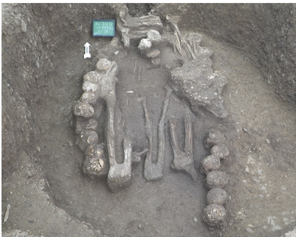
Figura 6. Alineamiento de cráneos rodeando a los individuos articulados. Enterramiento 29, monumento El Silo.

Destacan dos enterramientos en relación con el tema tratado. El 29 presentó cinco individuos articulados sobrepuestos, los cuales estaban rodeados de 41 cráneos colocados formando un arco (Figura 6). El 26 contenía dos individuos articulados rodeados por 10 cráneos colocados en semicírculo.