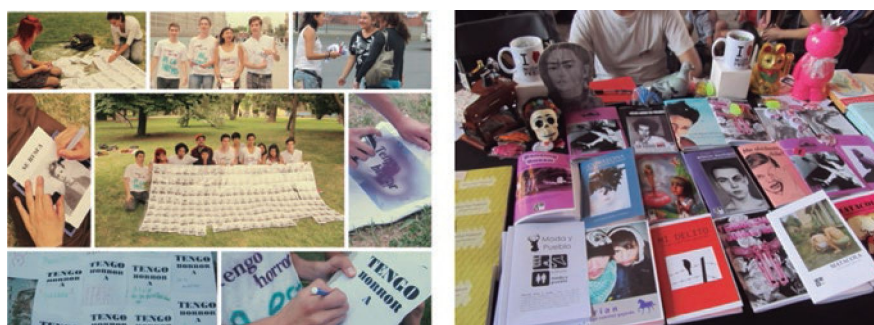
Figura 3 y 4

acuerdo con el testimonio de Ramírez, él eligió autopublicarse porque el libro que había escrito era altamente personal y no quería desprenderse de él ni exponerlo al escrutinio editorial, pero también porque su texto —que narra la pasión intensa y pasajera entre un adulto joven y un adolescente de las clases populares— se desviaba de varias maneras de lo aceptado por las editoriales y la crítica en términos temáticos, técnicos y estéticos. Además de enfocarse en masculinidades y sexualidades no hegemónicas, una parte del libro estaba construida a partir de materiales tradicionalmente no poéticos, como recortes de chat, mensajes de texto y fotografías íntimas; por otra parte, tenía una pésima ortografía, y un lenguaje poco pulido —estaba escrito “desde la carencia, desde el no saber hablar, desde el analfabetismo, pero también desde la urgencia” (Entrevista personal s.p.). Para Ramírez, Brian —como se le conoce más popularmente a este libro— era la manifestación del margen en múltiples niveles, y por lo tanto debía ser publicado desde allí, desde la precariedad, pero también desde la autonomía que ofrece la autoedición.