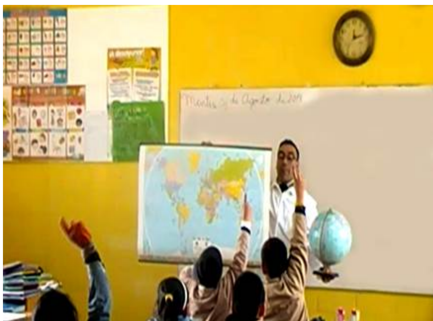
FIGURA 1 Profesor mostrando los dos modos a sus estudiantes

Además, el profesor de 3° básico en sus clases utiliza –dentro del medio impreso- dos modos de representar la Tierra: un planisferio y un globo terráqueo. En la Figura 1 se distingue al profesor mostrando los dos modos a sus estudiantes.