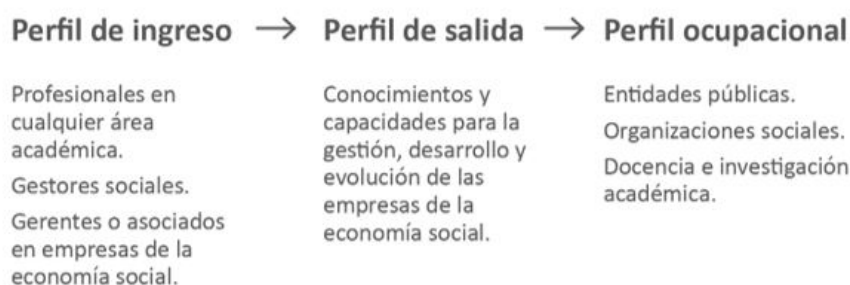
FIGURA 6 Resumen del análisis de los perfiles de ingreso, egreso y de ocupación