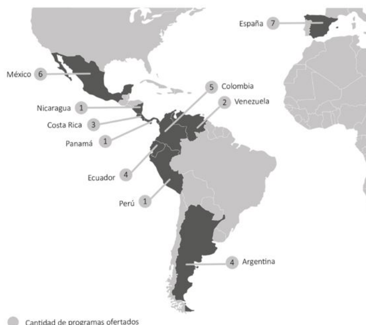
FIGURA 4 Cantidad de programas de maestría en economía social en España y países hispanohablantes de Latinoamérica