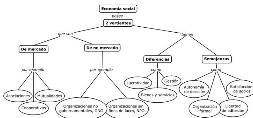
FIGURA 1 Dos vertientes de la economía social

La economía social se define en dos vertientes: la de mercado y la de no mercado, que se muestran en la Figura 1. En ambas vertientes las empresas son organizadas formalmente, con autonomía de decisión, libertad de adhesión y buscan satisfacer las necesidades de los socios. La vertiente de mercado produce bienes y servicios y la toma de decisiones ahí no está ligada a los aportes de capital, mientras que, en la de no mercado se producen servicios a favor de la familia y los excedentes no son de apropiación de los agentes económicos (Chaves et al., 2013; Pérez de Mendiguren, Etxezarreta y Guridi, 2008).