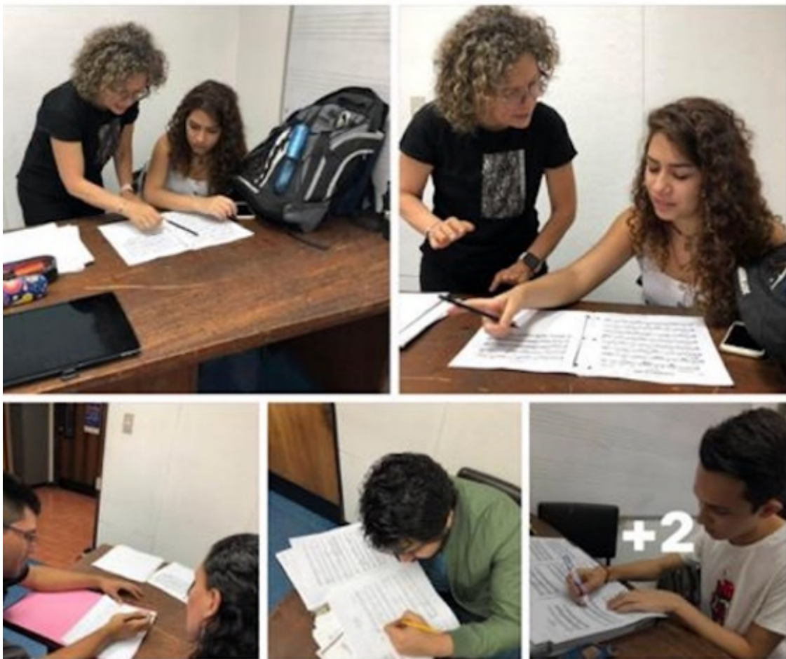
Modificaciones de los estudiantes a las partituras

Antes de cantar hay que decidir los tiempos, volúmenes, interpretación y marcarlo todo Eso se llama editar Aquí estudiantes UCR