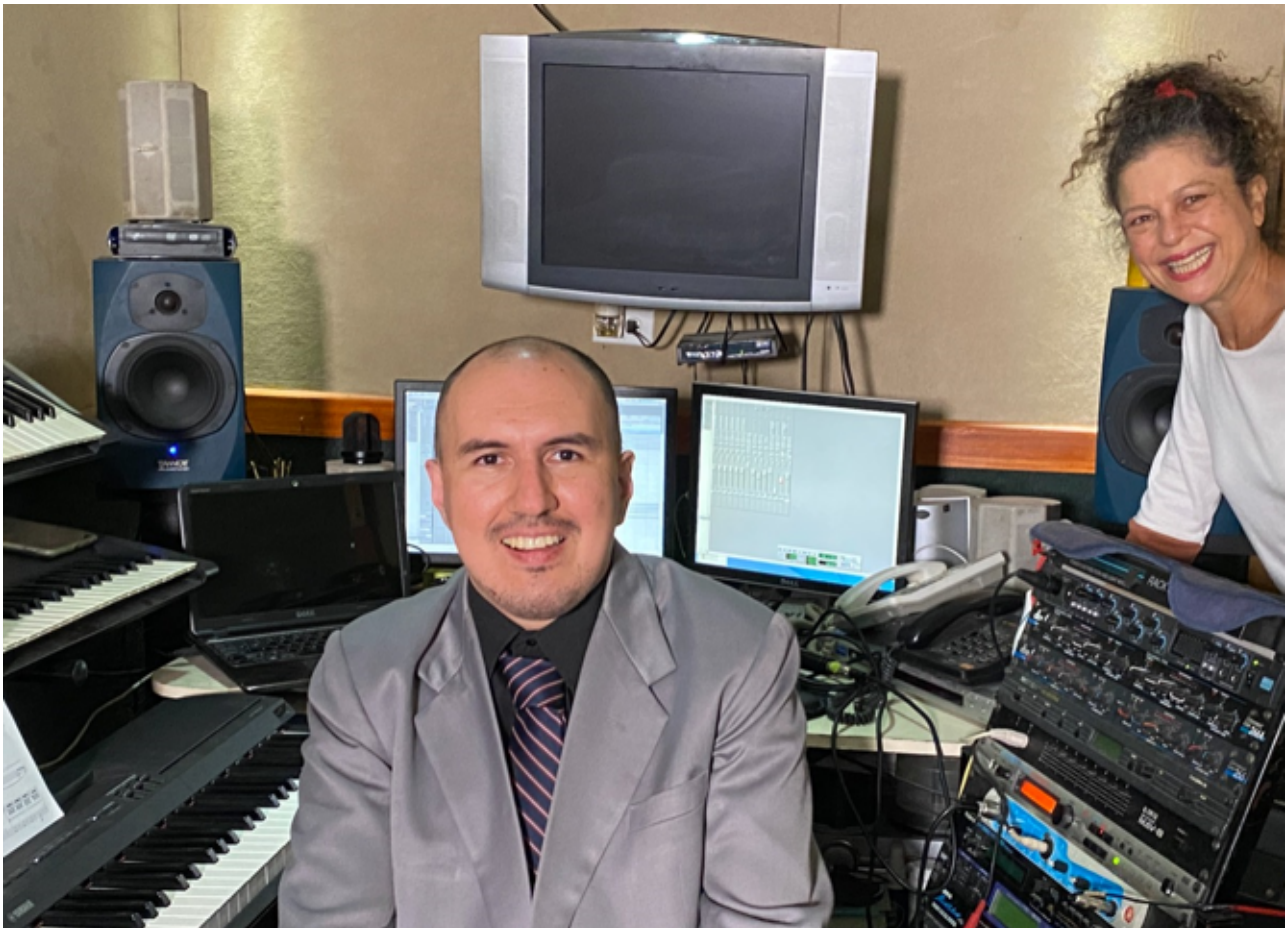
Experiencia profesional fuera del recinto universitario.