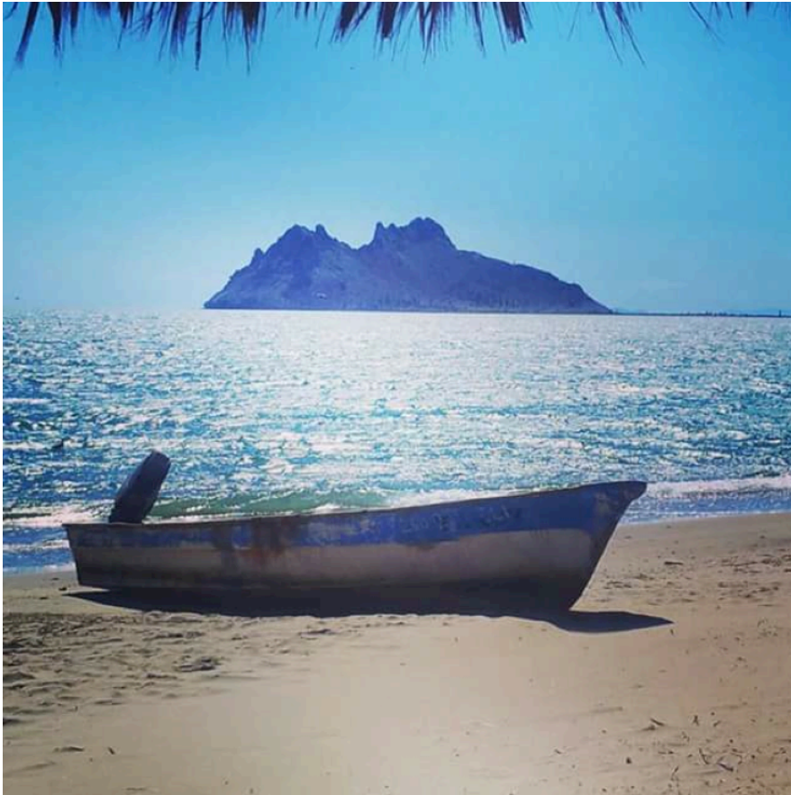
FIGURA 1. Isla Alcatraz 1