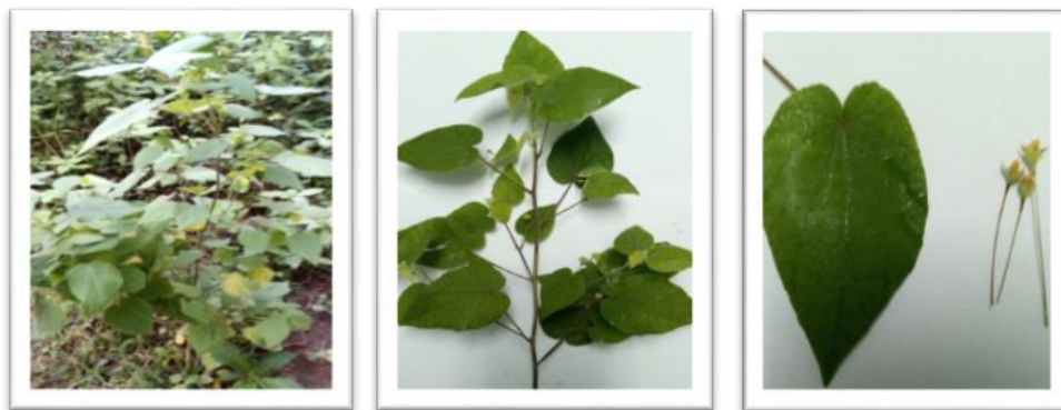
Fig. 1- Sida pyramidata Cav.

La especie Sida pyramidata Cav. (Yerba de aura) pertenece a la familia Malvaceae y está constituida por 250 géneros y 4230 especies. (1)