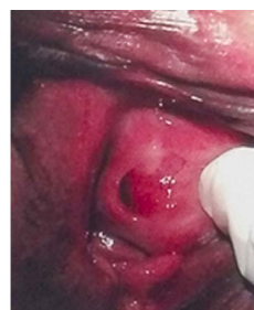
Figura 2. Uretra desplazada

Como exámenes complementarios se realizaron: