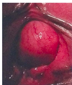
Figura 1. Masa parauretral.

A la exploración ginecológica : meato uretral lateralizado por presencia de masa parauretral izquierdo de 4x2x2 cm., superficie irregular, consistencia firme, móvil, no dolorosa, sin datos inflamatorios o secreciones trans-uretrales a la compresión de la misma ( Figura 1, 2).