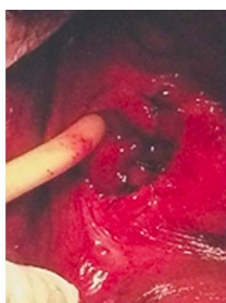
Figura 4. Lecho para-uretral de masa resecada