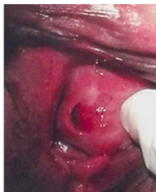
Figura 3. Excéresis de masa parauretral

dos planos, sin complicaciones, se deja catéter uretral por 7 días. El reporte histopatológico indicó leiomioma con degeneración hialina de 4x2x2 cm. Negativo a malignidad.