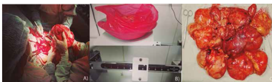
Figura 2. A) extirpación del liposarcoma retroperitoneal B) medición del peso de tumor C) recuento del tumor.

Se realizó una laparotomía con incisión media suprainfraumbilical con abordaje extraperitoneal, donde se identificó masa tumoral retroperitoneal gigante de predominio derecho, no adherido a estructuras vecinas, por lo que se logró la resección completa del tumor sin lesionar riñones, uréteres, ni hígado, se realizó revisión exhaustiva de todo retroperitoneo para la eliminación de posibles focos recidivantes, extrayéndose de esta manera aproximadamente 13 masas gigantes encapsuladas, además de otras masas pequeñas de color amarillo rojizo de aspecto adiposo, con un peso total de 6 100 gr ( Figura 2C), todas ellas exhiben una superficie externa roma, lisa y brillante, con escasos focos de hemorragia, a la evaluación anatomopatológica se establece tumor lipomatoso atípico/ liposarcoma bien diferenciado ( Figura 3).