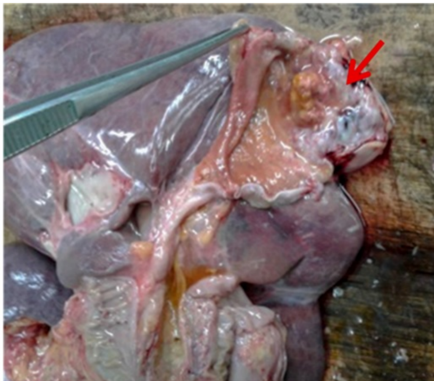
Figura 1. Tumor exofítico hacia el fondo de la vesícula biliar (flecha)