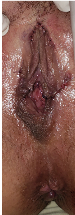
Figura 2. Conformación de los labios menores con colgajos de avance V-Y

Segundo tiempo quirúrgico, Se amplía la estrechez del introito realizando z-plastia de la horquilla posterior (Figura 3 y 4) ( Figura 5).