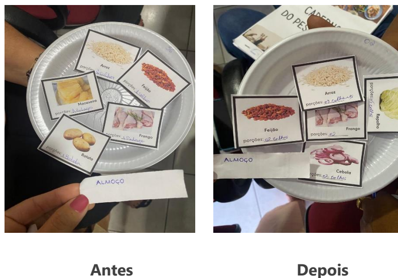
Figura 1 Refeições simuladas pelos participantes

Todos os participantes elaboraram os pratos considerando o que costumam ter em suas despensas e conforme a quantidade de refeições que costumavam realizar diariamente. Os resultados expressam a mudança na composição dessas refeições, que ampliaram a presença de alimentos saudáveis e reduziram a representação dos alimentos não saudáveis nos pratos elaborados de modo simulado (Figura 1).