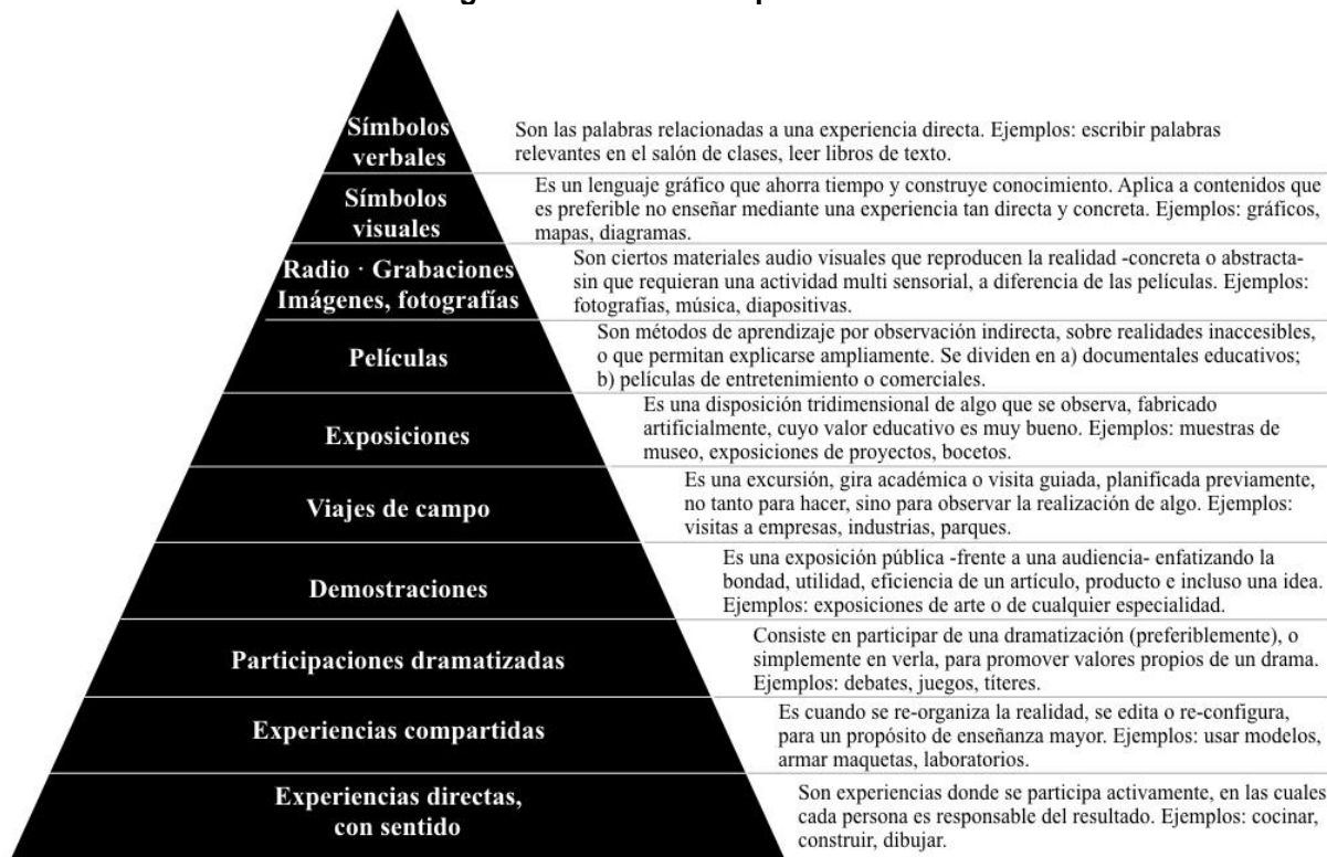
Figura 1. Cono de la experiencia 3