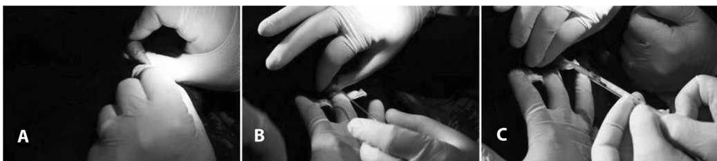
Fig. 1. Recolectación de semen en el jaguar ( Panthera onca ). (A) Limpieza del pene; (B) Introducción de sonda uretral; (C) Aspiración del semen con uso de jeringa de 1 mL acoplado en la sonda. Parque Zoológico Getúlio Vargas, Salvador-Bahia, Brasil.

Análisis y criopreservación del espermatozoide: Inmediatamente después de la recolecta seminal se evaluó la motilidad espermática, por medio de microscopio binocular, con un contraste de fases y un aumento de 100 X. Una vez confirmada la presencia de espermatozoides en la muestra, esta fue protegida de la temperatura y luz y se envió al sector RAOV-HOSPMEV / UFBA. Se cuantificó el volumen de la muestra con una micropipeta. El movimiento masal fue estimado basado en el movimiento de las células (Walton, 1952). El vigor espermático, el porcentaje de motilidad total (MT) y motilidad progresiva (MP) fueron estimadas subjetivamente por el mismo técnico en un microscopio binocular con contraste de fases (100 X). La concentración espermática se estimó usando un hemocitómetro. La integridad estructural de la membrana (EOS) se