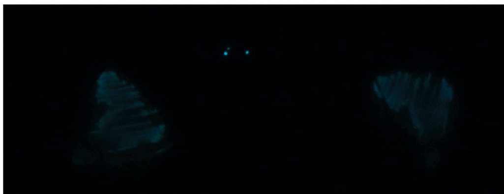
Fig. 2. Fotografía de bacterias luminiscentes cultivadas en agar Zobell aisladas de la Isla del Coco, Costa Rica, observadas en oscuridad total y sin exposición de ningún tipo de fuente de luz.

Se obtuvieron siete aislados de bacterias luminiscentes de agua marina: seis a nivel superficial y una mediante buceo de roca Dos Amigos (20 m de profundidad) de la Isla del Coco, Costa Rica (Fig. 2, Tabla 1, Tabla 2). En cuanto a la morfología macroscópica