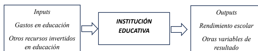
Figura 1. Proceso de producción de educación

sus costos sujetos a restricciones y obteniendo la mayor cantidad de producto (Nicholson & Snyder, 2015). El sistema educativo de acuerdo a esta teoría (Aturupane, 2017), transforma los insumos (inputs) en los productos (outputs). Siendo el objetivo de la educación básica regular. “priorizar la educación básica de calidad, promover una gestión educativa eficiente y descentralizada, y otros” (MINEDU, 2022). Lo que busca la función de producción educativa es relacionar varios insumos (inversión pública, número de estudiantes por maestro, infraestructura, servicios básicos, entre otros) (Soleimanipirmorad & Vural, 2018), que influyen en los resultados educativos (logros en comunicación y matemática), evidenciados en los resultados de pruebas estandarizadas (Oluwatayo et al., 2023). La institución educativa es la encargada de llevar a cabo el proceso de transformación, como se muestra a continuación (Hien, 2018).