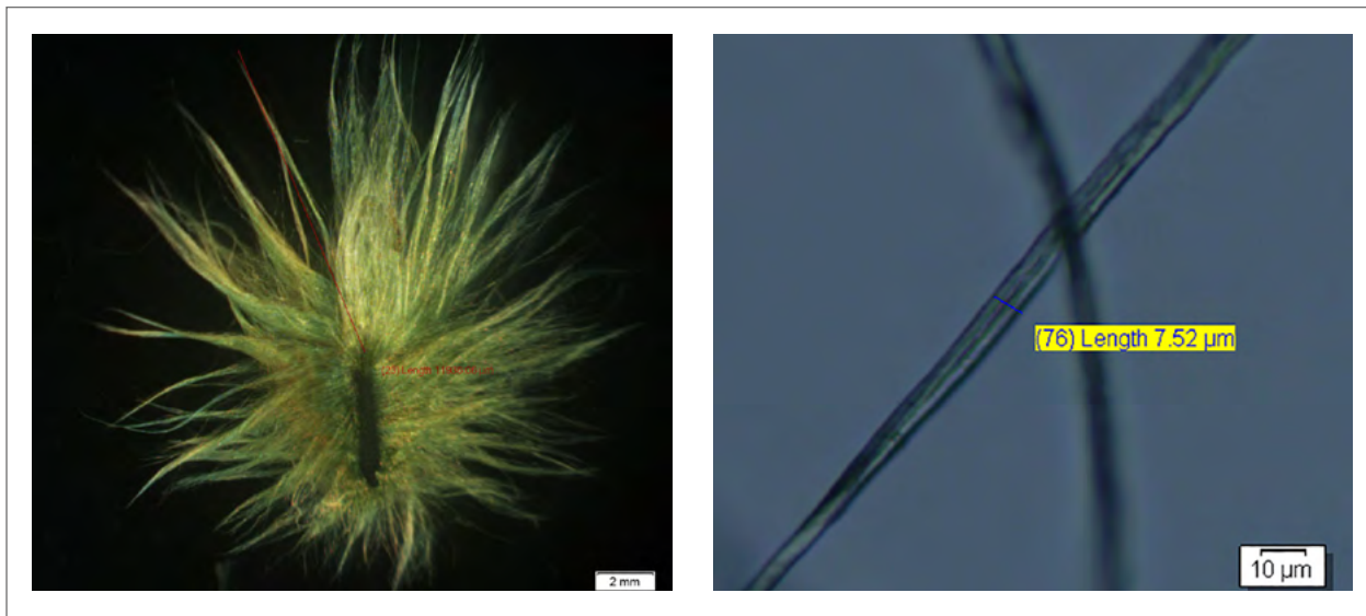
Figura 1. Medición del largo y ancho de fibra de G. raimondii , ecotipo algodón silvestre.