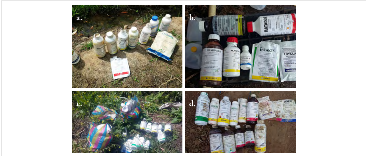
Figura 3. Envases de plaguicidas dispersos en campos de cultivos de Ecuador. a. Arenillas, provincia del Oro; b. Pedro Carbo, provincia del Guayas; c. Pallatanga, provincia de Chimborazo; d. El Morro, provincia de Santa Elena.

mente mujeres y niños. Estudios realizados en Ecuador detectaron la presencia de residuos de plaguicidas clorados en los productos finales de los cultivos de papa, pimiento y tomate, pero con cantidades que no superaron los límites máximos permitidos (Ministerio de Ambiente, 2004). Otras investigaciones efectuadas sobre la canasta básica familiar en muestras de tomate recolectadas en cuatro provincias del país determinaron que los residuos del plaguicida metamidofos se encontraban ocho veces sobre el Límite Máximo de Residuos (LMR) (Crissman et al., 2002).