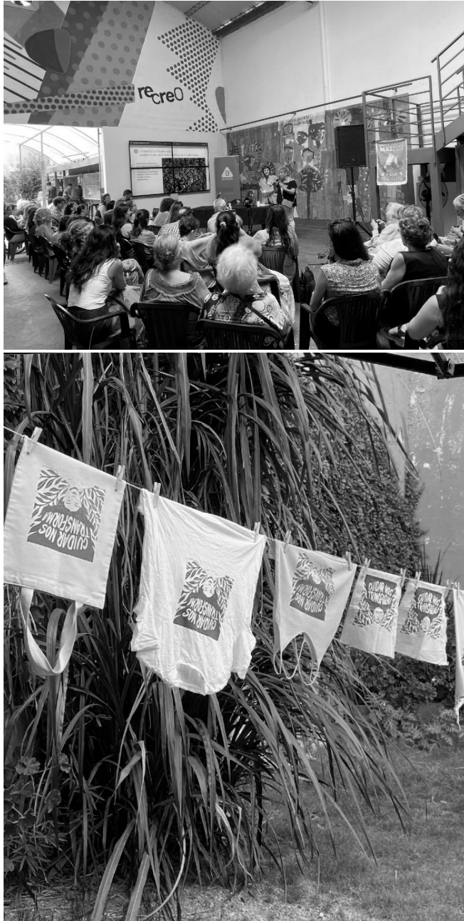
Encuentros de «Cuidar nos transforma» en Ciudad Vieja en marzo de 2022. La primera es de elaboración propia; ambas publicadas por el Municipio B.