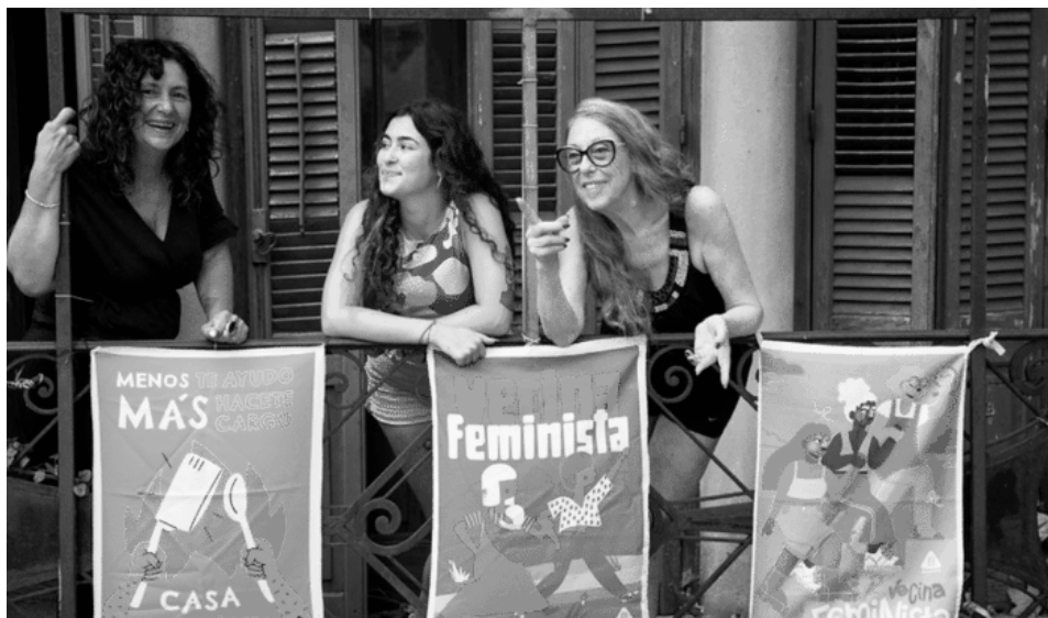
Ganadoras de las ediciones de Balconeras Feministas de 2021, 2022 y 2023.