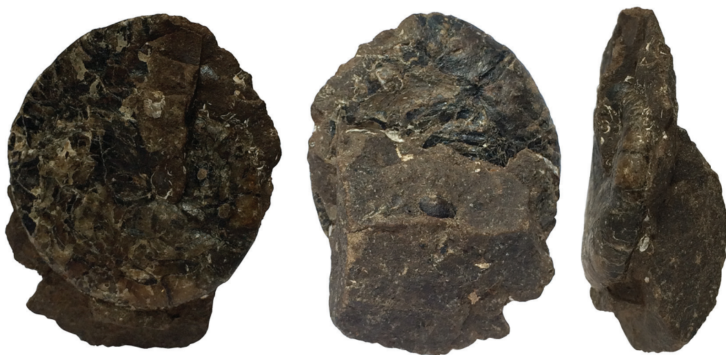
Fig. 2: ejemplar CFM-5273, fragmocono de Aturia cubaensis (Lea, 1841) en a. y b. vistas laterales y c. vista mediana, Fm. Punta Carballo, Mioceno Inferior – Medio. Escala visual 10 mm.

El patrón de las líneas de sutura en la especie Aturia cubaensis (Lea, 1841) se caracteriza por presentar una silla mediana convexa, sillas laterales amplias y subcirculares, cuyos extremos por lo general no llegan a unirse en la costura umbilical y un lóbulo ventral lanceolado, ligeramente inflado cuyo extremo posterior se aproxima mucho al borde lateral de la silla mediana de la sutura posterior (Fig. 3a). Este patrón se observa claramente en el ejemplar del presente estudio (Fig. 3a), al igual que en el ejemplar descrito por Miller et al. (1955) para el Caribe de Costa Rica (Fig. 3b), así como en ejemplares de otras latitudes (Fig. 3c) y permite diferenciarlo del patrón de la línea de sutura que presenta la otra especie del Mioceno, Aturia aturi (Basterot, 1825), caracterizado por