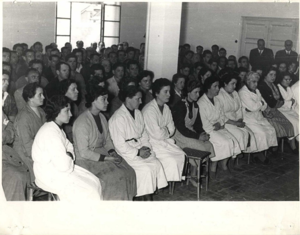
Figura 2. Ejercicios espirituales abiertos para obreros, provincia de Guipúzcoa, 1956