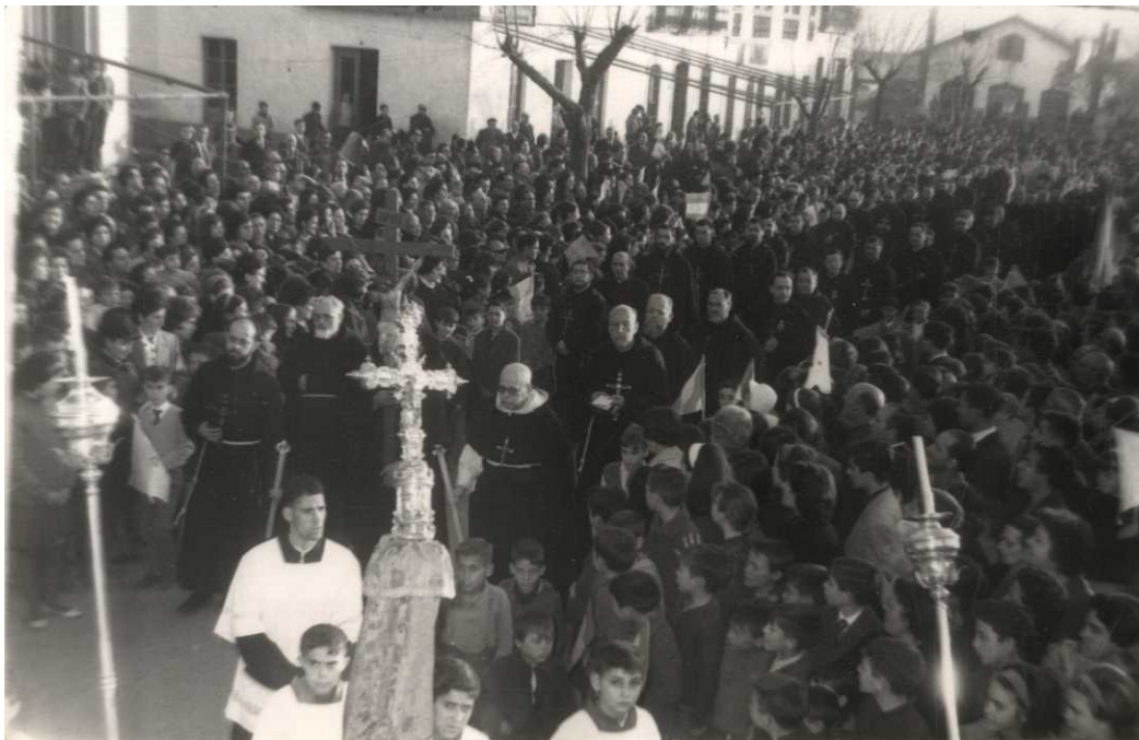
Figura 1. “Entrada solemne” de los misioneros en El Ferrol (La Coruña), 1960