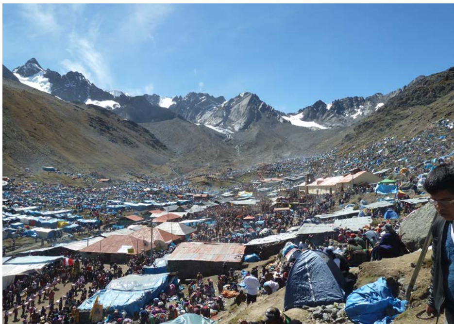
Foto 1. El santuario de Qoyllurit'i en el día central.

Fuente: imagen tomada por el autor en 2013