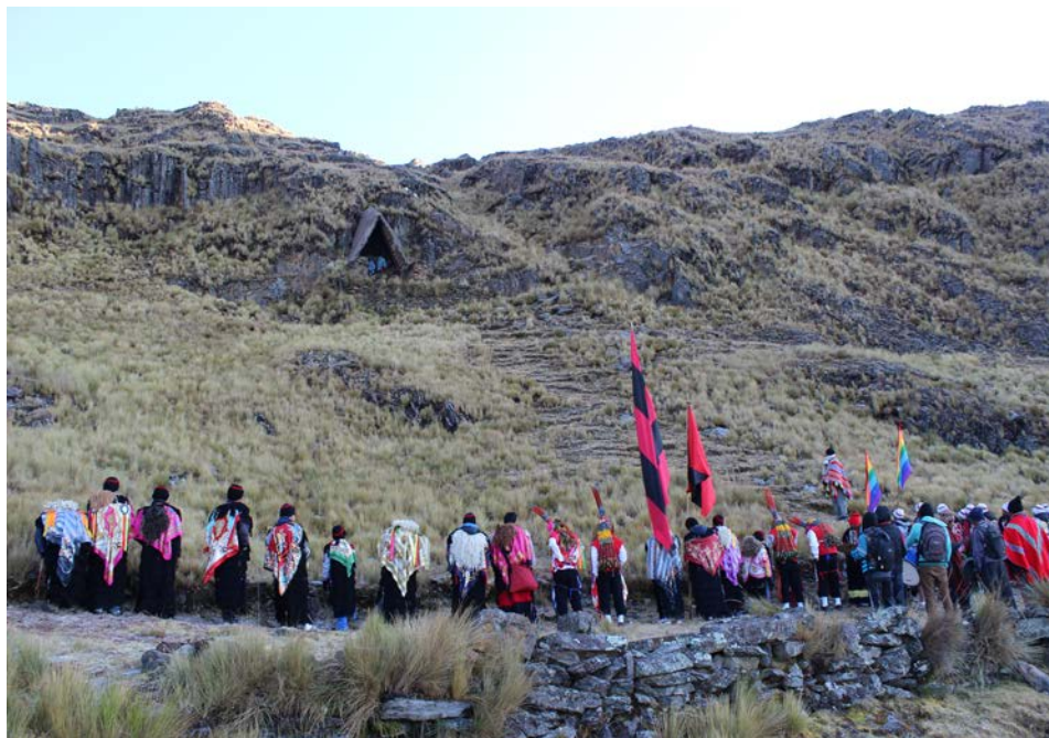
Foto 2. Santuario de Qhanqawani y danzantes.

Fuente: imagen tomada por el autor en 2015