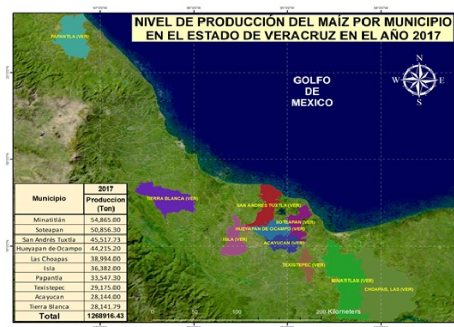
FIGURA 4 Mapa productivo de maíz en Veracruz 2017

elaboración propia con datos del Servicio de Información Agroalimentaria y Pesquera, (2017) y el procesamiento en el software QGIS.