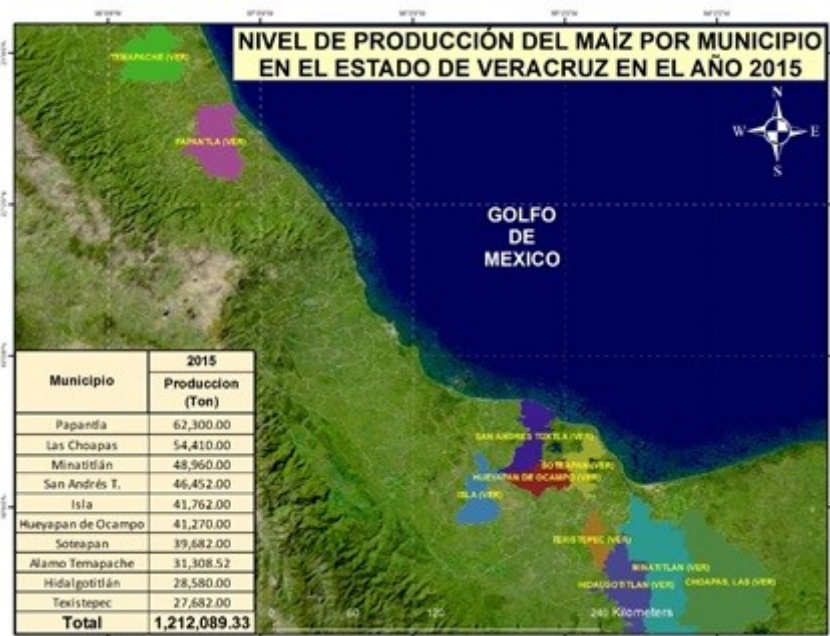
FIGURA 2 Mapa productivo de maíz en Veracruz 2015

Con respecto al año 2015, Papantla, Las Choapas y Minatitlán fueron los tres principales productores de (tabla 1 y figura 2). En este año el mapa productivo muestra el municipio de Papantla ubicado al norte, Las Choapas y Minatitlán ubicados al sur donde obtuvieron una producción de 62,300, 54,410 y 48,960 toneladas de maíz respectivamente; en este año con respecto al 2014, hubo un aumento de la producción de + 26,099.06 toneladas de maíz y un aumento del valor económico de la producción de + $60,672.02 pesos (Servicio de Información Agroalimentaria y Pesquera, 2015), esto se debe a que el consumo de maíz ha ido en aumento.