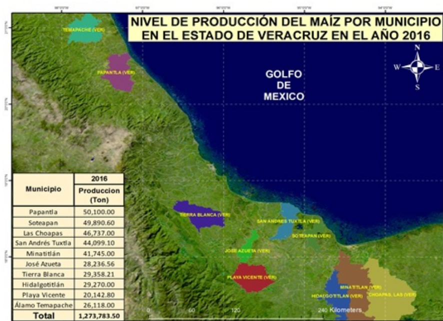
FIGURA 3 Mapa productivo de maíz en Veracruz 2016

En lo que se refiere al año 2016, los principales productores fueron: Papantla, Soteapan y las Choapas (tabla 1 y figura 3). Podemos observar en la figura 3, el municipio de Papantla ubicado en el norte, y al sur del estado los municipios de Soteapan y Las Choapas con una producción de 50,100.00, 49,890.60 y 46,737.00 toneladas respectivamente, en este año con respecto al 2015, se tuvo un aumento en la producción de maíz a 61,694.17 toneladas y un aumento en el valor económico de la producción de $251,584.73 pesos (Servicio de Información Agroalimentaria y Pesquera, 2016), esto es debido a dos factores económicos importantes: se presentó un aumento en el precio internacional del maíz que se establece para todo el mundo en dólares en la Bolsa de Futuros de Chicago (CBOT) [1] además hubo una fuerte depreciación del peso frente al dólar.