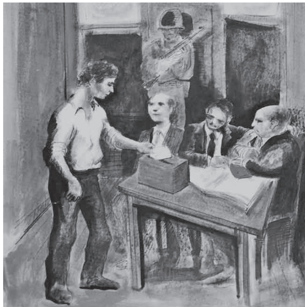
FIGURA 2. LÁMINA PALABRA GENERADORA “VOTO”