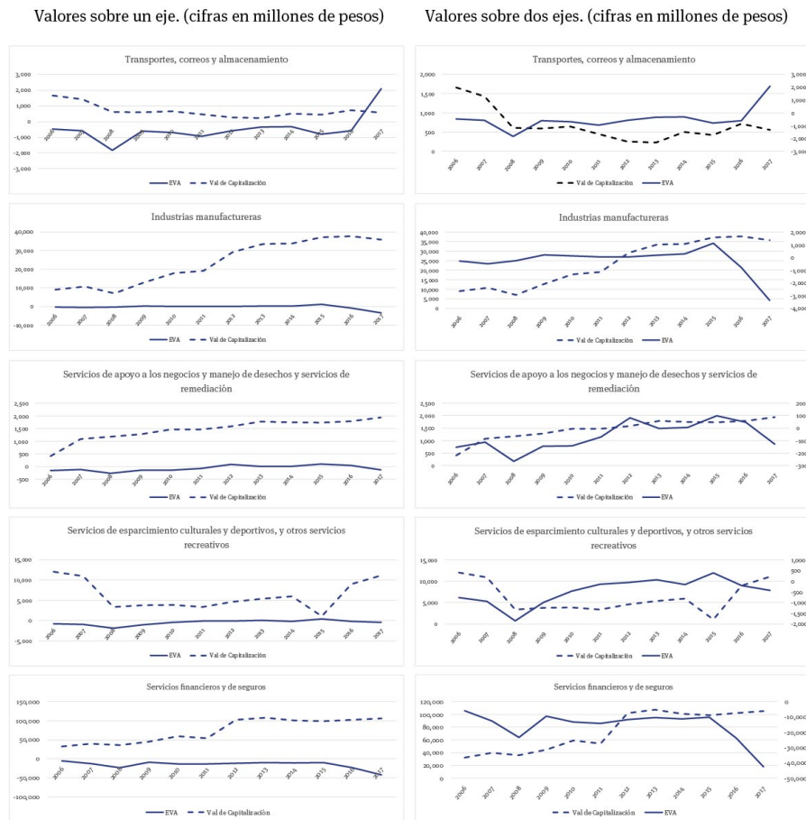
Figura 3. Gráficas comparativas de los valores EVA - valor de capitalización por sector (cifras en millones de pesos) Fuente: elaboración propia con datos de Banco de México (2019a, 2019b); BMV (2019b); El Financiero (2006-2017) y Economática (2019).

Lo anterior se confirma con lo arrojado en la tabla 2, donde los valores para el coeficiente de Pearson son inferiores al 75 % en todos los casos, por lo que se afirma que no existe una relación entre los valores sectoriales de EVA y el valor de capitalización.