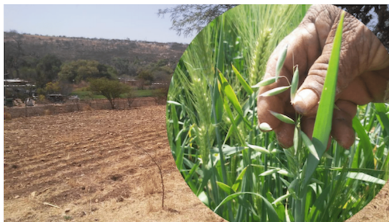
Figura 4. Sistema agrícola en laderas y cultivos de grano