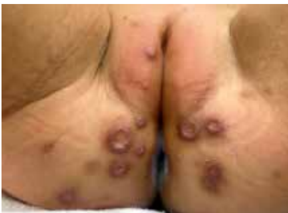
Figura 2 Imagen macroscópica de la lesión

Se observa la presencia de 11 lesiones en la región genital y perianal en pliegues interglúteos