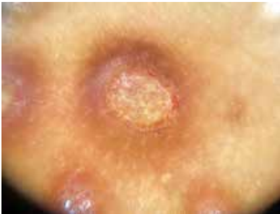
Figura 1 Imagen por dermatoscopia

Dermatoscopia de la lesión en la que se observan imágenes características de sifiloide posterosivo de Sevestre-Jacquet: lesiones en sacabocados, con bordes elevados y bien definidos con fondo de fibrina