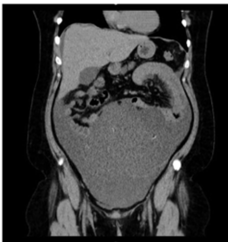
Figura 2 Tomografía computarizada de abdomen y pelvis

Corte coronal que muestra extensión de teratoma maduro con diferenciación maligna, así como la presencia de componente heterogéneo y septos