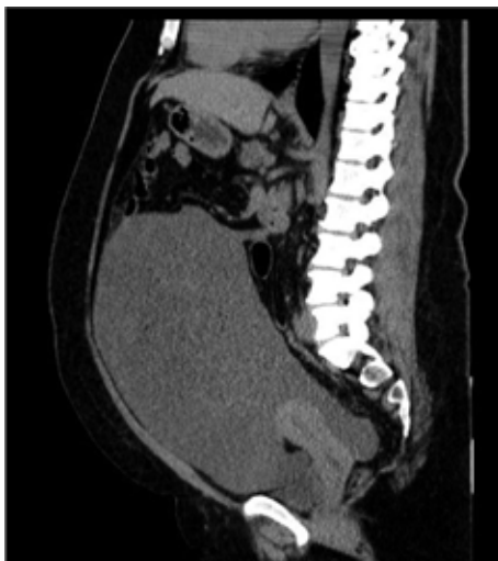
Figura 1 Tomografía computarizada de abdomen y pelvis

Corte Sagital que muestra extensión de teratoma maduro con diferenciación maligna de 28 x 12 x 27 cm