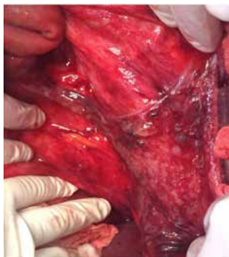
Figura 3 Laparotomía con citorreducción primaria

Fotografía que muestra múltiples implantes de mucina en peritoneo parietal y visceral