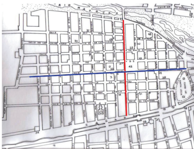
Figura 2: Plano de Santiago en que se ha superpuesto los cuadrantes del Decreto Real, 12 de febrero de 1764 15

Las únicas coordenadas de norte a sur, fueron el eje de las calles Puente-Ahumada y de oriente a poniente el eje Merced-Compañía. El cuadrante Puente/Merced, correspondió al cuartel N° 1; el cuadrante Merced-Ahumada, correspondió al cuartel N° 3; el cuadrante Ahumada/Compañía, correspondió al cuartel N° 4; el cuadrante de