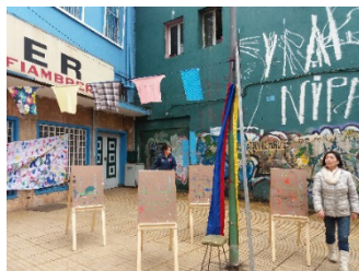
(a) Muro alledaño a cecinas Sethmacher