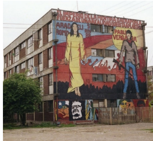
Figura 4. Mural del Taller de Pintura Popular, Villa Francia, 1989.

Las entrevistas indican que las organizaciones territoriales se financiaban mediante colectas entre sus integrantes y, ocasionalmente, entre