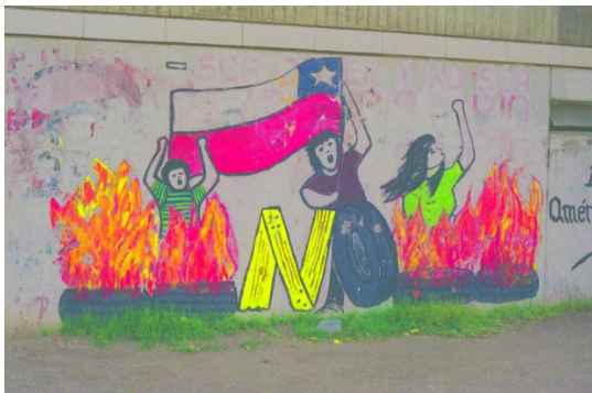
Figura 6. Mural referente al plebiscito. Brigada Muralista América Latina, Villa Portales, 1988. El tratamiento digital mediante DStretch revela la superposición sobre un mural con el rostro y una cita de Allende.