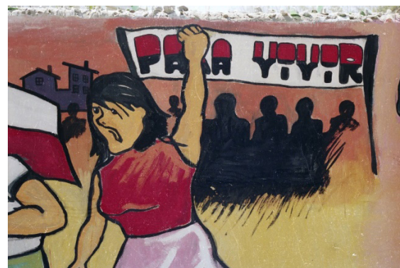
Figura 5. Detalle de mural de la Brigada Luciano Cruz, 1988. De estilo lineal figurativo, polícromo, con letras gruesas, responde al prototipo del muralismo del período.

representaciones pictóricas. Vale la pena destacar la escasa presencia de murales exclusivamente de texto, más comunes en las décadas precedentes y que volvieron a predominar en las campañas presidenciales y parlamentarias de los años noventa. No obstante, es posible que esto se deba a un sesgo de registro. Entre los estilos de letra utilizados predominaron caracteres lineales o rellenos, que facilitan la legibilidad a distancia, y particularmente los de tipo Palo Seco (sin serifas), más sencillos de ejecutar. El estilo de dibujo predominante fue siempre el lineal figurativo (Figura 5).