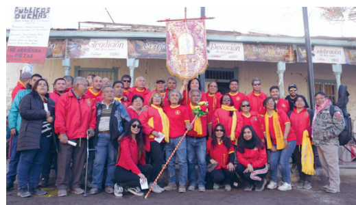
Imagen 3. Agrupación Rompía del Día, tus devotos por siempre

Esta actividad es llevada a cabo por un grupo llamado “Rompía del Día, tus devotos por siempre”, de manera autónoma de la Iglesia Católica. No está en el programa oficial y no cuenta con el apoyo del aparato eclesiástico, pero, aun así, es posible entender este espacio como una negociación que, en base a “dejar hacer”, la Iglesia católica tolera. Un tiempo y un espacio administrado por el grupo que durante todo el año se organiza para llevar a cabo esta ceremonia.