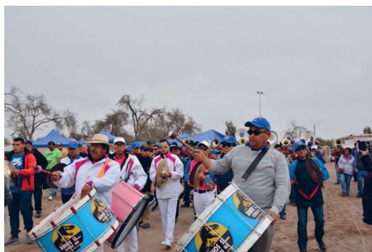
Imagen 2. Músicos rumbo al cementerio

llega al cementerio. Hoy está todo poblado con casas.