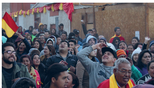
Imagen 5. Devotos que participan de la Rompía del Día