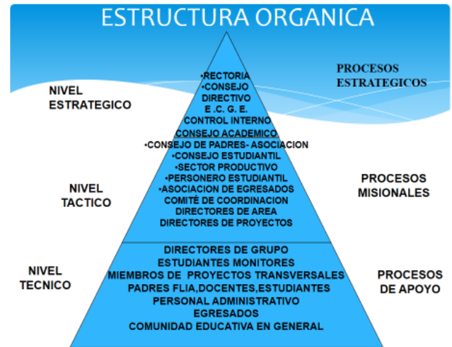
Gráfico N° 3. Organización vertical de los miembros de la comunidad.

A continuación, una gráfica, en la que se expone la distribución de las tareas, en niveles de gerencia, en forma piramidal y vertical.