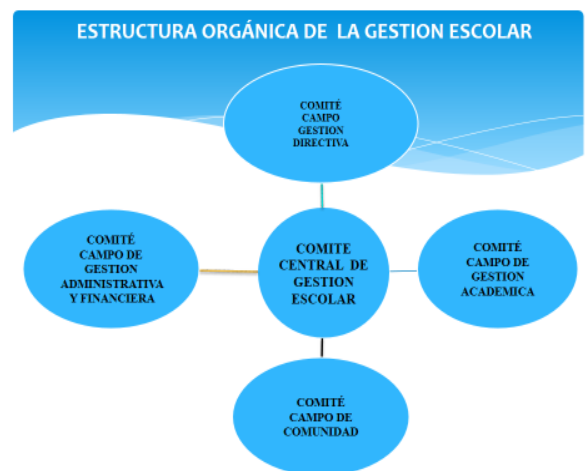
Gráfico N° 2. Estructura orgánica de la gestión escolar.

La figura que se incluye, permite precisar, desde la perspectiva del pensamiento crítico y de la aplicación del liderazgo horizontal del directivo-docente, como se estructura el proceso de gestión escolar.